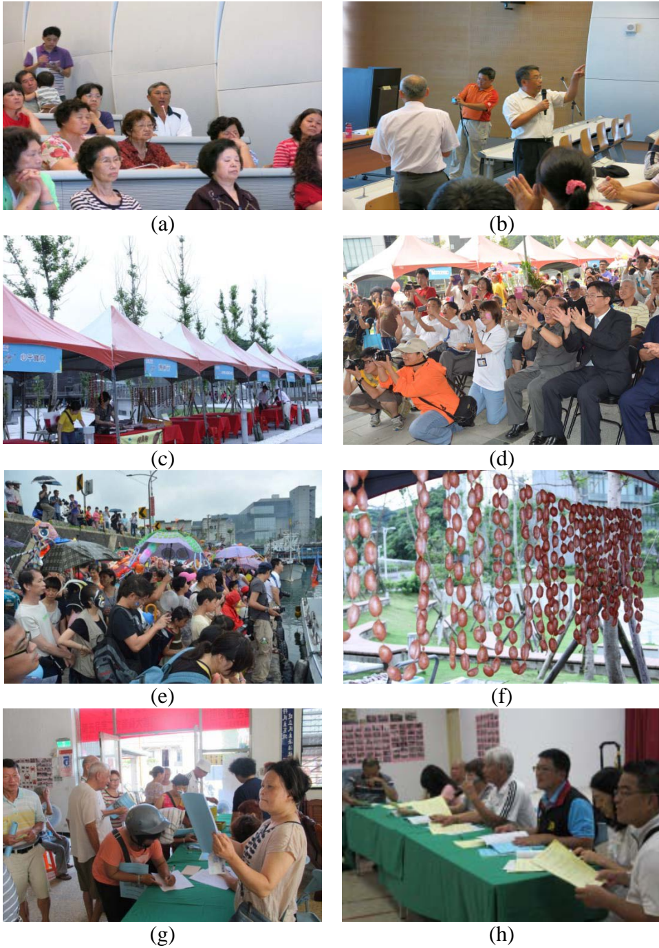
圖 2. (a)(b)居民自決社區發展與專家輔導；(c)(d)海洋市集活動；(e)漁村文化體驗-「薪傳·新船」活動；(f)特色地方加工食品；(g)(h)第二次八斗子漁村社區居民大會。