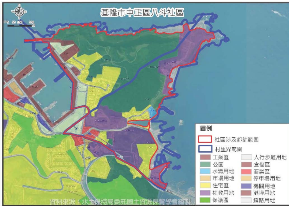
圖 4. 八斗子社區申請農村再生涉及都市計畫範圍區域